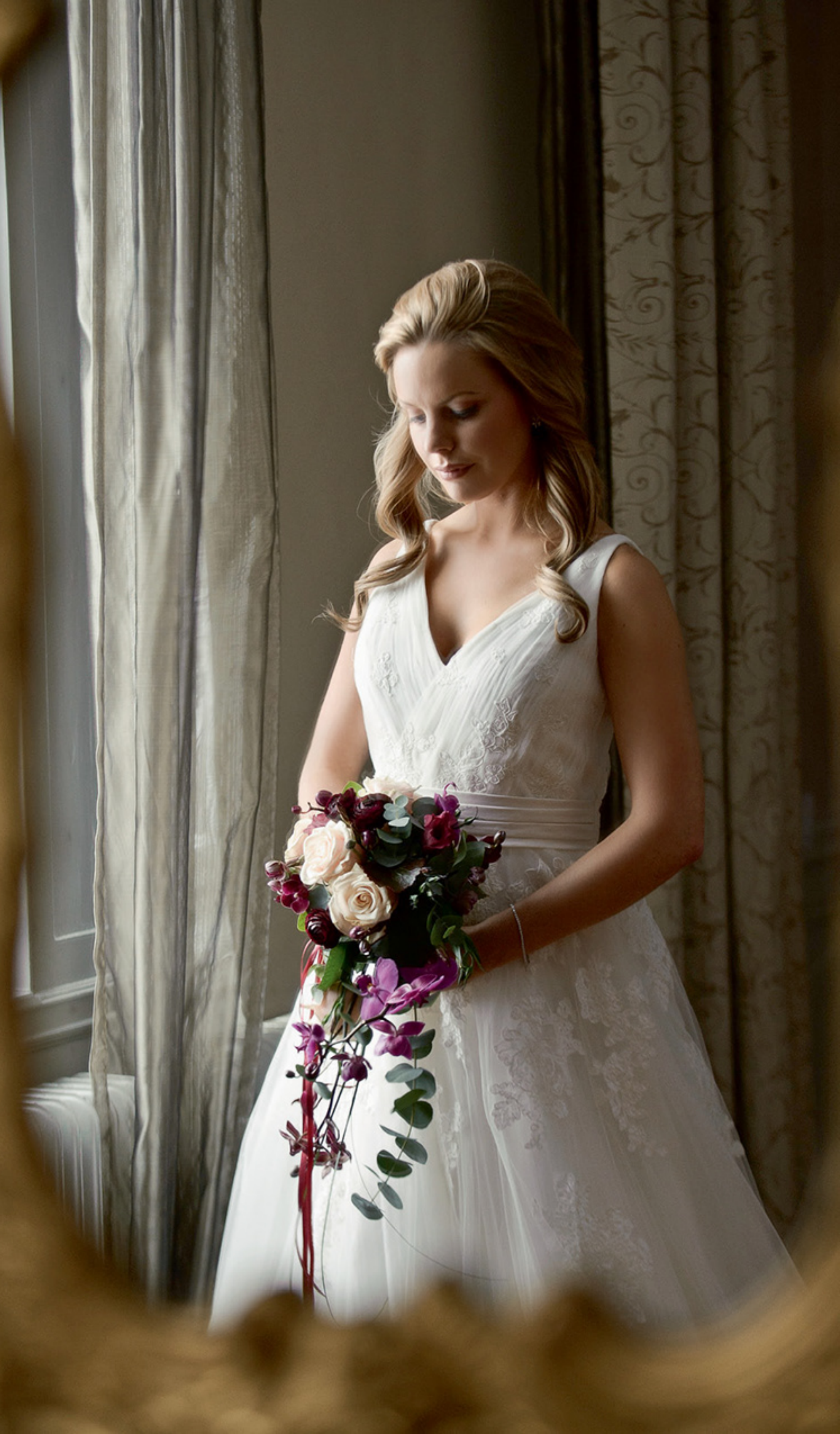
Brudklänning, 7900 kr, Milagro de Nahrin. Armband, 26 999 kr, Albrekts guld. Brudbukett med rosor och orkidéer, 2600 kr, Blomsterhallen.