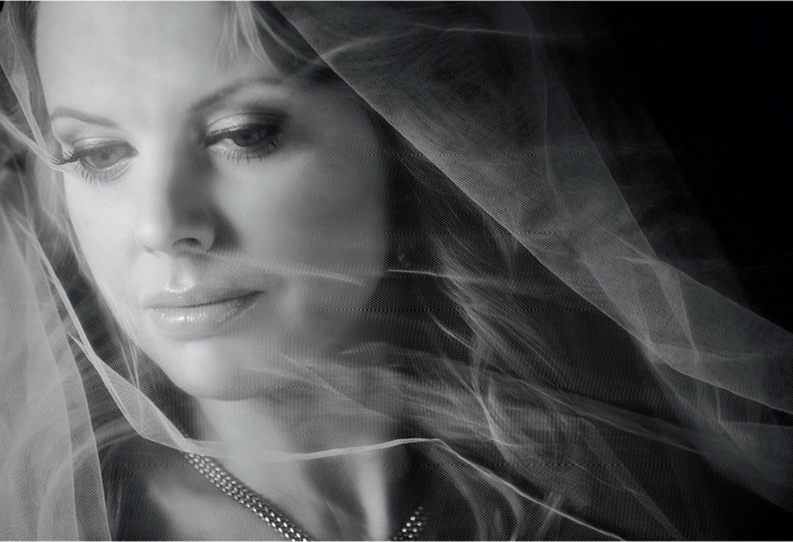
Slöja från Garamaj. Pärlörhängen, 750 kr, Yvone Christa. Halsband i 18k vitguld med gula och vita diamanter, totalt 1,83 ct, 66 500 kr, VJ since 1890.